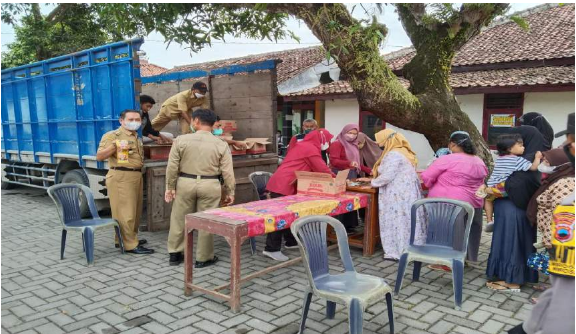
22 Februari 2022, Operasi Pasar minyak goreng kemasan 1 Ltr Rp 14.000 oleh Disperindag Kabupaten Grobogan di Halaman Kecamatan Wirosari.