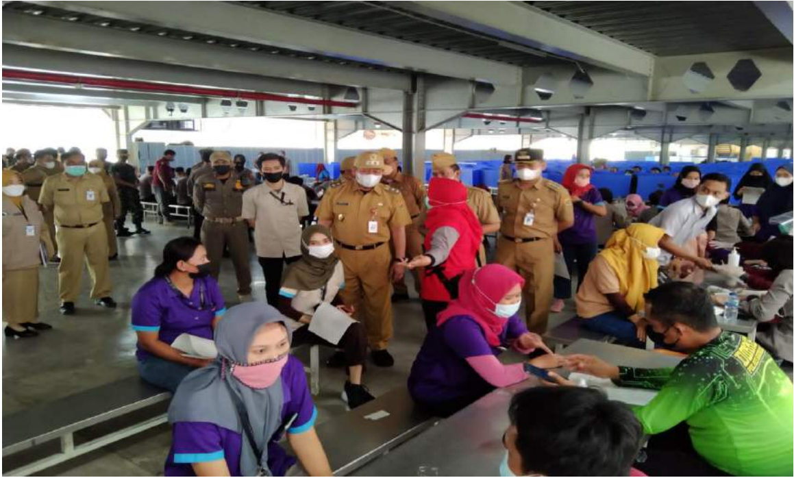
21 Februari 2022 , Vaksinasi Booster Polres Grobogan di PT Pungkok Indonesia di hadiri oleh Wakil Bupati DAN Kapolres Grobogan.