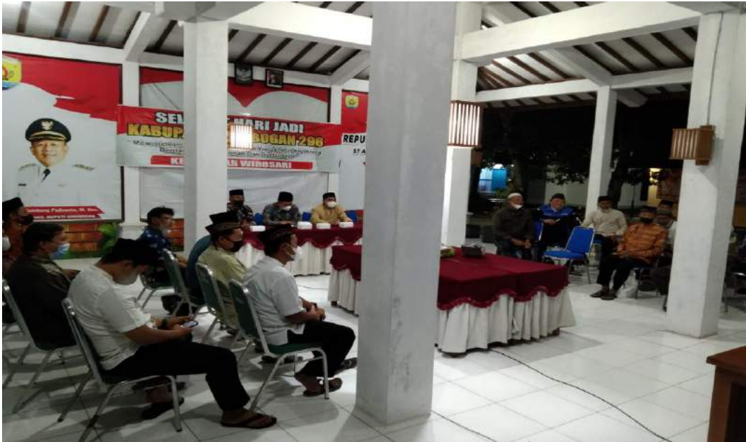
03 Maret 2022 Tirakatan Hari Jadi Grobogan ke-296 di Pendopo Kecamatan Wirosari