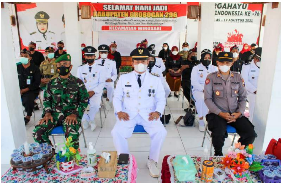
04 Maret 2022 Upacara Hari Jadi Kabupaten Grobogan ke – 296 di Pendopo di ikuti oleh Kepala Desa dan Lurah serta Staf Kecamatan Wirosari